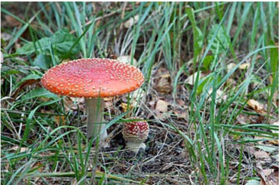
Iso ja pieni, Pertti Jämä, kunniaininta. Hieman perinteisemmin sommiteltu sienikuva, kuin nuorten sarjan voittanut kuva. Sienet sijoitettu kuvassa kultaiseen leikkaukseen, mikä saa aikaan harmonisen kokonaisuuden.