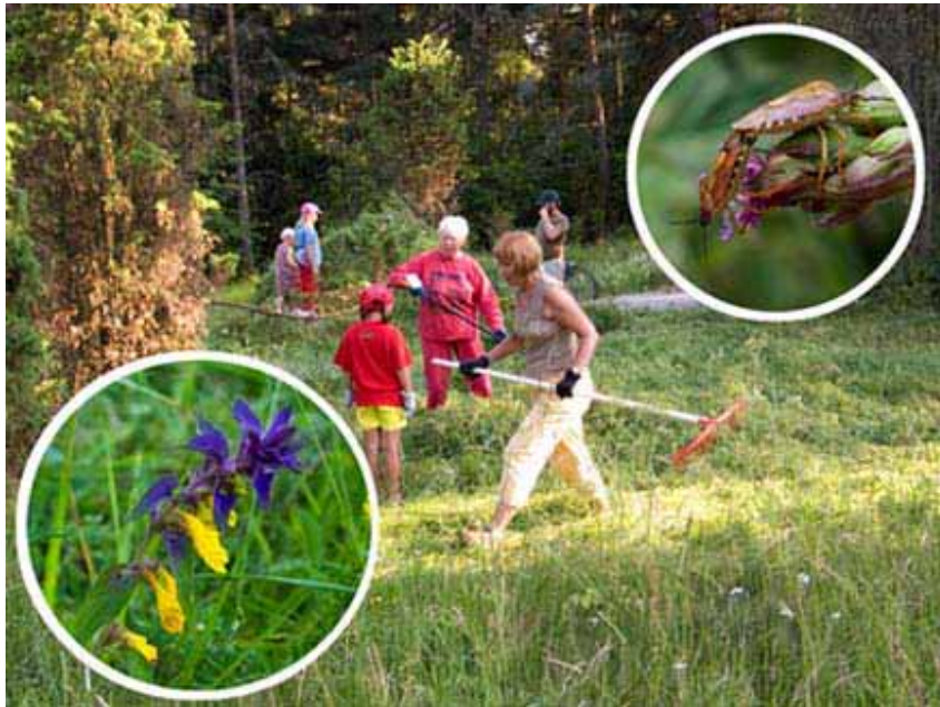
Luonnonsuojeluyhdistyksen niittotalkoot Tuulilankedolla kesäkuussa 2006, ja kedon erikoista lajistoa: lehtomaitikka ja kuparilude.

Keto on luontokoulun välittömässä läheisyydessä ja luontokoululaisille erittäin tärkeä oppimisympäristö. Läheisen Hulvelakodin vanhukset ovat viime aikoina enenevässä määrin löytäneet kävelyretkillään tiensä kedolle. He eivät niinkään pysty kulkemaan kallioalueilla, mutta kedolla he voivat poimia kukkia ja nauttia luonnosta. Luonnonsuojeluyhdistys on jo parina vuonna kesäkuussa luonnonkukkien päivänä järjestänyt kasviretken, jolla raisiolaiset ovat Eeva Ennolan opastuksella saaneet tutustua kedon kasveihin.