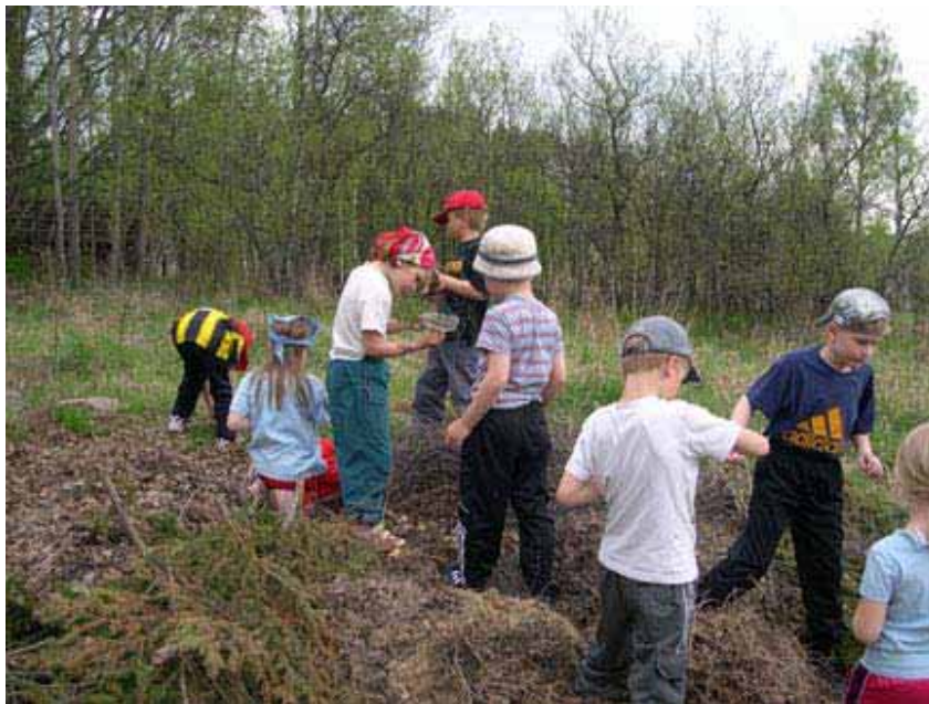
Pieniä luontokoululaisia luontoa tutkimassa.

Alue on yleiskaavassa merkitty lähivirkistysalueeksi ja tulisi sellaisena myös säilyttää. Keskustan väkimäärän voimakas kasvu aiheuttaa lisäpaineita paremminkin lähellä sijaitsevien virkistysalueiden laajentamiseen kuin supistamiseen. Kuuanmetsän alueen tulee olla kaikkien raisiolaisten käytettävissä. Friisilän alueelle ei pidä rakentaa teitä eikä asuntoja. Se on rakennuksineen, kyläteineen ja perinnemaisemineen merkittävä kulttuuriympäristö Raisiossa.